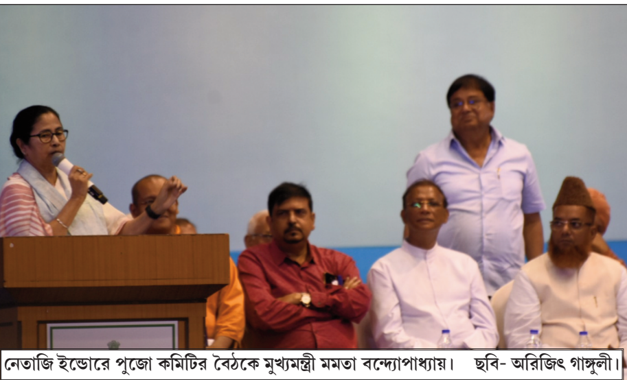
নেতাজি ইন্ডোর পুজো কমিটির বৈঠকে মুখ্যমন্ত্রী মমতা বন্দ্যোপাধ্যায়।

স্টাফ রিপোর্টার : দুর্গাপুজোর অনুদান বাড়িয়ে দিলেন মুখ্যমন্ত্রী মমতা বন্দ্যোপাধ্যায়। ৬০ হাজার থেকে বাড়িয়ে পুজোর অনুদান ৭০ হাজার টাকা করা হয়েছে। মঙ্গলবার নেতাজি ইন্ডোর পুজো কমিটিগুলির বৈঠকে এই অনুদানের কথা ঘোষণা করেন মুখ্যমন্ত্রী। একইসঙ্গে বিদ্যুতের বিল ১/৪ ভাগ দিতে হবে বলেও জানিয়ে দেন মমতা বন্দ্যোপাধ্যায়। উৎসবের মরশুমের অগ্রীতকর ঘটনা এড়াতে পুলিশ-প্রশাসন ও পুজো কমিটিগুলিকে একগুচ্ছ নির্দেশও দিয়েছেন মুখ্যমন্ত্রী। এর পাশাপাশি পুজো কমিটিগুলিকে সরকারের বিভিন্ন দফতর বিজ্ঞাপনের হোডিং দেওয়ার নির্দেশও দিয়েছেন তিনি। পর্যটন থেকে শিল্প দফতর সরকারি কাজের হোডিং দেবে বারোয়ারি পুজোকে। সেই বাদও টাকা পাবে পুজো কমিটিগুলি। মমতা পরামর্শ দিতে গিয়ে বলেন, “পুলিশের